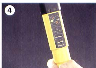
NOTE ALCOHOL READING

*เราสามารถเลือกเก็บตัวอย่างลมหายใจได้ 2 วิธีดังนี้* (1) ให้เป่ายาวๆ ตรงที่โคนรับตัวอย่าง จนไฟสีส้มติด หรือ (2) กดปุ่ม Passive ในขณะพูดหรือเป่าลมหายใจเบาๆ