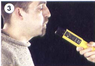
THE SUBJECT BLOWS

3. เป่าลมหายใจเข้าไปในถ้วยรับตัวอย่าง ยาวๆ จนไฟสีส้มติด หรือ กดปุ่ม "Passive" ในขณะพูด