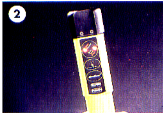
AUTOMATIC SELF CHECK

2. เครื่องจะทำการตรวจเช็คความพร้อม ให้รอจนไฟเขียวปรากฏขึ้น ที่ตำแหน่งไฟบอกสถานะ ( Wait/Ready )